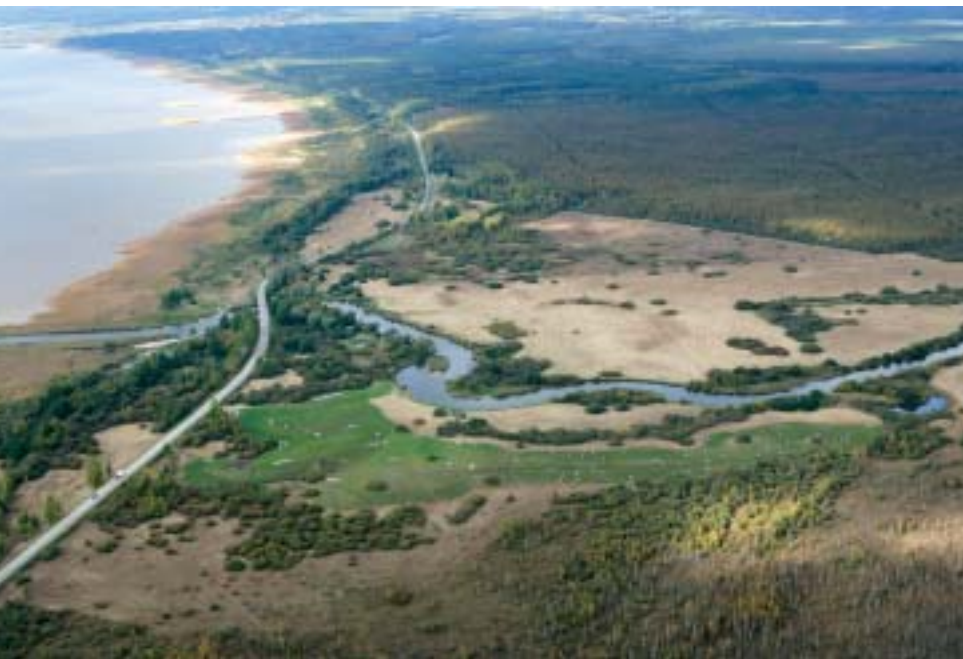
Õhuvaade Jõesuule